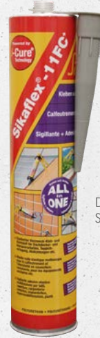
Dichtungsmasse Sikaflex-11FC+ (1756)