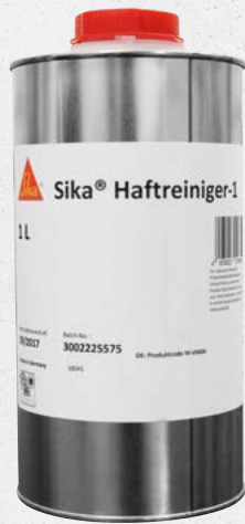
Sika Haftreiniger-1 (1754)